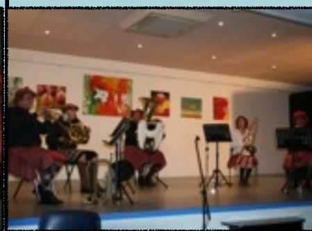
VENT D'ANGES Musique & Humour