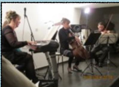
Soirée privée Entreprise avec Conférence

Une conférence musicale très enrichissante et fortement appréciée dans le Centre Social Emile Jourdan de Nîmes Quartier Gambetta mettant ainsi la culture au service de la population.