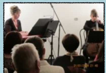
Conférence sur le répertoire romantique