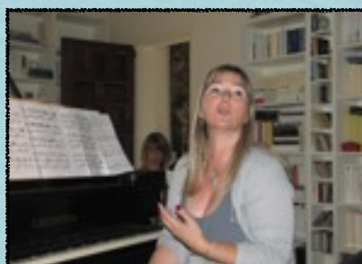
Conférence chez un particulier ... «Autour de la danse »