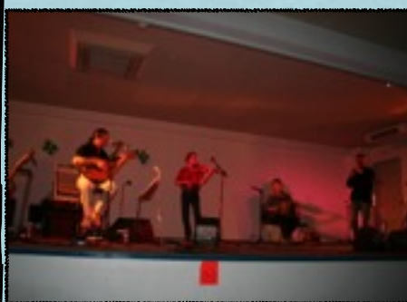
CAORAN Tradition & Musique irlandaise