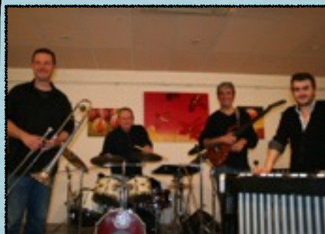
HUMAN QUARTET Jazz & créations