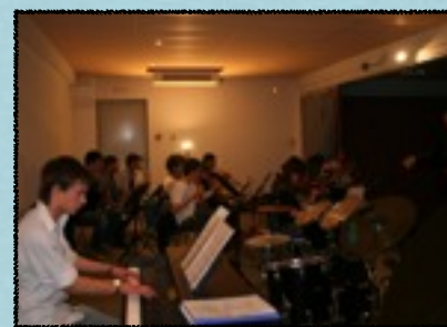
Accompagnement Piano de la classe d'orchestre 2006

Accompagnement piano de la classe de chant