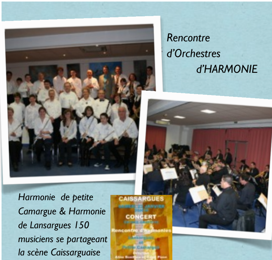
Rencontre d'Orchestres d'HARMONIE

- Une rencontre avec petite formation « l'orchestre en kit » et l'orchestre du département.